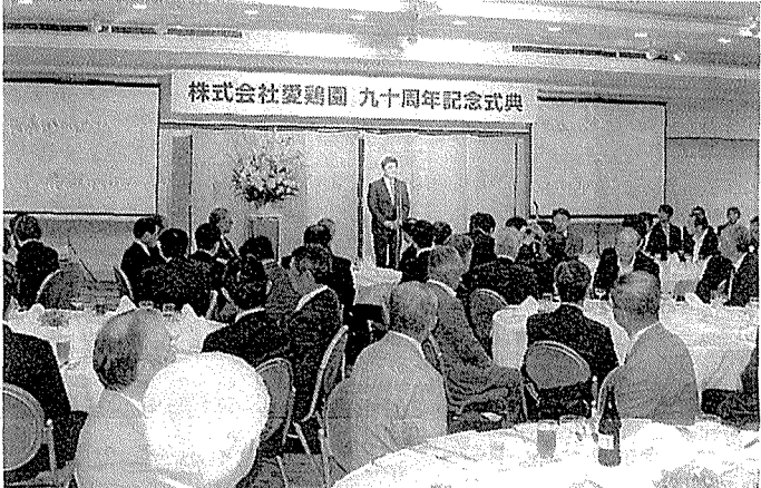
取引先関係者らを迎えて開催された90周年記念式典

「愛鶏園の歴史は、日本の養鶏界の歴史そのものであり、今後を、平成12年に現在の愛鶏園に統合し、平成18年業界を引っ張っていただけると思っています」と述べた。