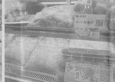
地養卵と地養鳥の両協会、技研食品、貞光食糧工業などによる展示