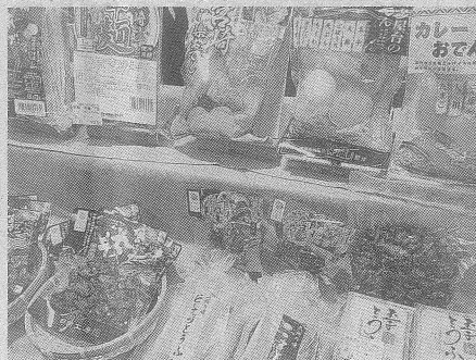
鶏卵・鶏肉の香川ランチグループも参加(写真は宮崎デリカフーズ)