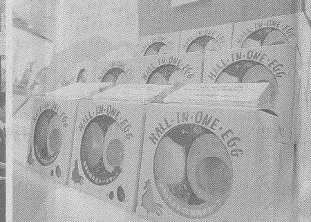
日清丸紅飼料の配合飼料や、食品を販売する山忠商事(兵庫県)