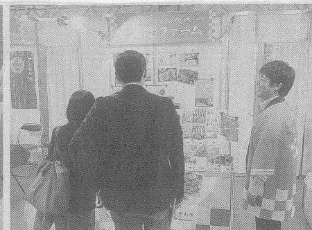
卵と米粉使用のスイーツを出品した出雲ファーム