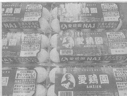
愛鶏園はブランド卵『NAI 1』に幸せづくりへの思いを込めた