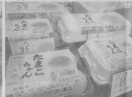
カミヤタマゴは鶏の飲水や、殺菌・洗浄水の質にこだわる