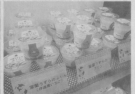
室蘭うずら園はウズラ卵とフルーツ使用のプリンなどを出品