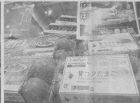
北海道産飼料を多く使ったホクレンの『養コクたまご』