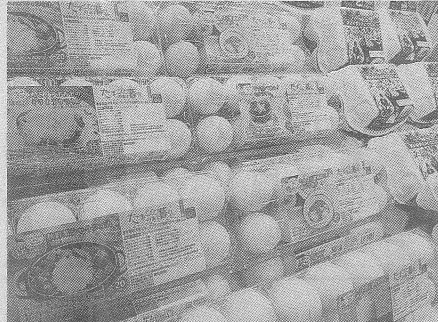
昭和鶏卵は『たまごのある暮らし』のパッケージでも卵レシピを提案