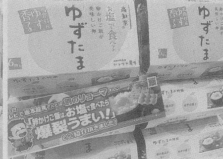
「塩かけTKGがうまいぜよ」。高知・ヤマサキ農場の『ゆずたまご』