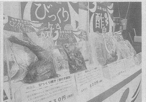
島根県益田市で親鶏肉のおいしさを発信するポニイも参加した