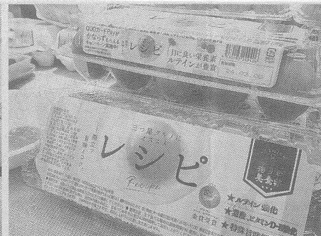
エムイーシーフーズのルテイン強化ブランド卵『レシピ』