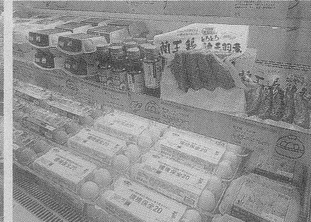
環境に配慮した卵から、親鶏肉の活用まで提案したJA全農たまご