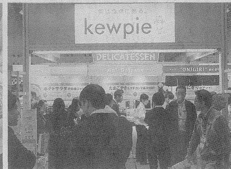
今年のキューピーは卵焼き、ポテトサラダ、おにぎりの提案を強化