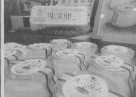
野上養鶏場は『味宝卵』と、その卵黄のみを使った『生ぷりん』を紹介

(一社) 全国スーパー 日に千葉市美浜区の幕張マリーナに於ける「スーパーマーケット・トレードショー」が2月14、15、16日3日間にわたって開催され、219社が出展し、7万5858人が来場した。本紙関係の出展者は50社を越え、このうち食鳥